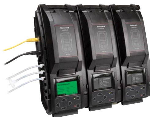
IntelliDoX automatiskt instrumenthanteringssystem